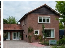
IPSO Centrum Waalwijk