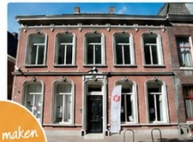
IPSO Centrum Tilburg